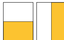
Halvsida 210 x 130 / 105 x 260 mm