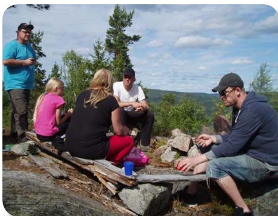
Fika utomhus under guidning

Vi erbjuder i dagsläget framförallt guidning på svenska, men några av våra guider kan guida på engelska. Vi har tillgång till nederländsk tolk, mot extra avgift.