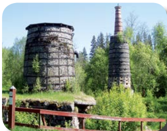
Masugnen på Lögdö bruk