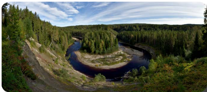
Mjällåns slingrande genom Mjällådalen

Snöskovandring: Upplev närheten till naturen vintertid